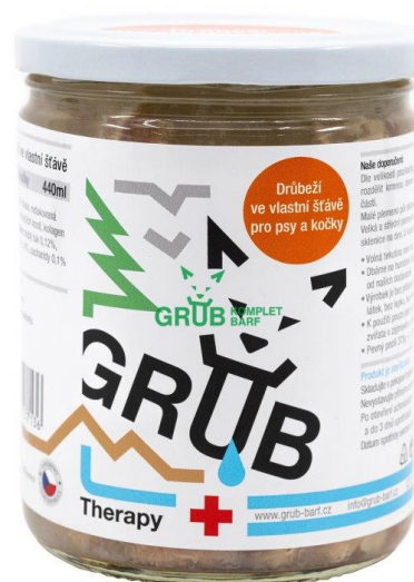
Kuřecí ve vlastní šťávě 440 ml

Žraso s.r.o.: vyrábí tři produktové řady GRUB BARF pro komplexní krmení domácích mazlíčků. BARF krmivo pro psy a kočky obsahuje pouze čerstvé, nejčastěji tepelně neupravené raw ingredience té nejvyšší kvality. Syrová strava pro psy a kočky je plná bioaktivních vitamínů, enzymů a minerálů, které domácí mazlíčky navrací k jejich přirozenosti. Zákazníci mohou vybírat z nabídky krmiva Komplet pro vyváženou výživu, řady Beetles® obohacenou o vysokoproteinový hmyz a unikátní řady Therapy pro nemocná zvířata. Více na https://www.grub-barf.cz/produkty/ . GRUB je anglické slovo, které má mnoho významů. Jedním z nich je slengově žrádlo psy.