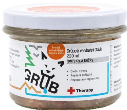
Kuřecí ve vlastní šťávě 220

obsahuje libové hovězí, které je významným zdrojem kreatinu a má vysoký obsah esenciálních aminokyselin a nízký obsah tuku. GRUB BARF s hovězím masem je nutričně velmi hodnotné, má nízký obsah tuku a hodí se pro nabírání svalové hmoty a udržení dobré kondice. Je určen pro vysoce aktivní kočky. Jedna porce Hovězího s přílohou GRUB BARF obsahuje 62,6 % proteinů, 20,5 % tuků a 16,9 % uhlohydrátů (sacharidů). Má ideální vlastnosti pro budování svalové hmoty, regeneraci a udržení dobré fyzické kondice vašeho zvířete.