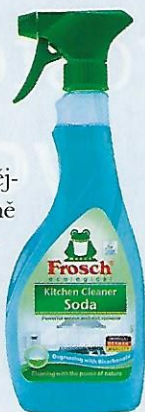
Čistič na kuchyně Frosch, Kč 89,90

Před pár lety jsem se rozhodla postupně nahrazovat klasické čisticí prostředky těmi, které jsou šetrné k životnímu prostředí. Ekologičtější alternativu k chemickým variantám nabízí i výrobky Frosch. Jejich výhodou je snadná biologická odbouratelnost a zároveň obnovitelnost použitých zdrojů. Nejvíce využívám Čistič na kuchyně s přírodní sodou. Má čistou, příjemnou vůni a je šetrný i k té nejcitlivější pokožce, což s malými dětmi oceňuji. Perfektně odstraňuje nečistoty a zashlou masť. Používám ho v podstatě na všechny omyvatelné povrchy v domácnosti. A díky obsahu přírodní sody se nebojím čistit ani v blízkosti potravin.