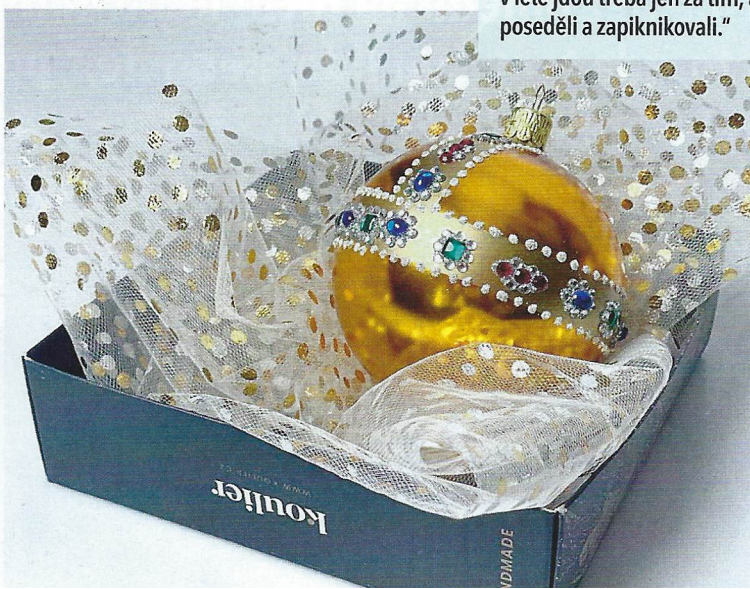
Česká sklárna Koulier reagovala na korunovaci krále Karla III. ozdobami inspirovanými britským královským jablkem.