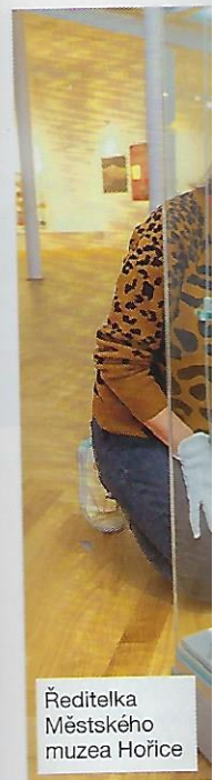
Ředitelka Městského muzea Hořice