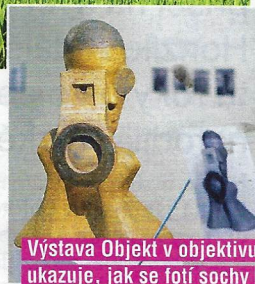
Výstava Objekt v objektu ukazuje, jak se fotí sochy