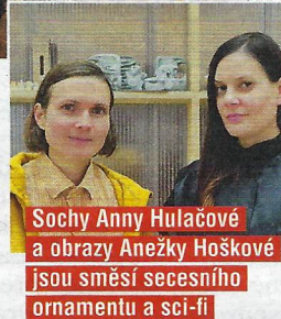
Sochy Anny Hulačové a obrazy Anežky Hoškové jsou směsí secesního ornamentu a sci-fi