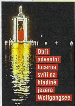
Obří adventní lucerna svítí na hladině jezera Wolfgangsee

hudby neklidně ohlížely přes rameno a ve střehu čekaly, kdy na náměstí vzlítne nějaké přepadové komando nebo se z oblak snese na padáku James Bond... ☺ Velký dojem na nás zanechal adventní trh v rakouském městečku St. Wolfgang , které leží u stejnojmenného krásného jezera. Uprostřed vodní hladiny postavili obrovskou zlatou lucernu , kterou nelze díky své výšce 19 metrů přehlédnout ani ve dne, ani večer, kdy zářivě svítí do dálí. A zaujala nás i místní tradice „Když se večer setmí“ .