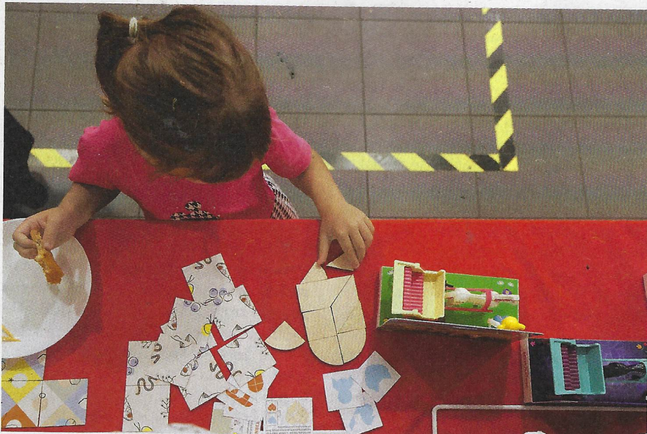
Efko sází nejen na nostalgii, ale vymýšlí i nové hračky pro současné děti.