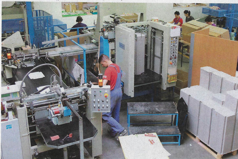
Základem firmy je kartonáž. Díky ní potiskne a zabalí i své vlastní produkty.