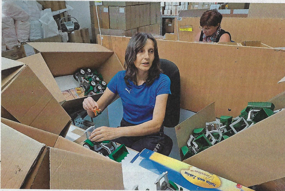
Stroje hračky vylisují, ovšem zkompletovat je musejí lidské ruce.