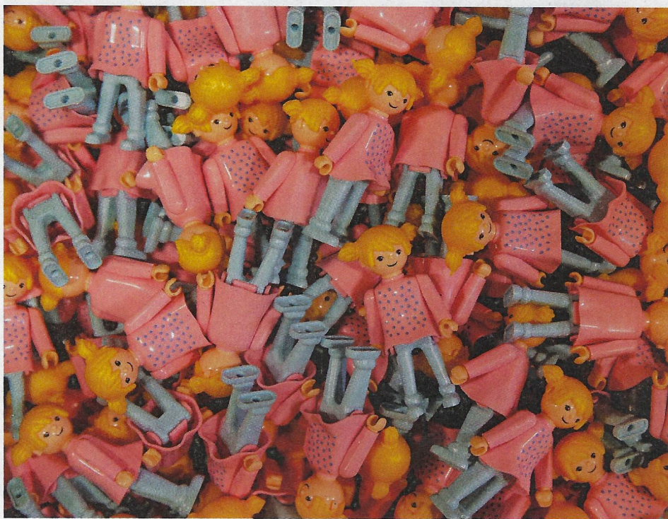
Igraček dostal partnerku – s různými vlasy, oblečením i pracovními úbory.

Miroslav Kotík koupil veškerá práva i výrobní formy a v roce 2010 uvedl znovuzrozenou figurku na trh. Tímto tahem refil jackpot, protože Igraček je hitem, který nejen z nostalgie kupují rodiče a prarodiče svým dětem a vnučatům. Každý rok opustí brány závodu až 300 000 figurek.