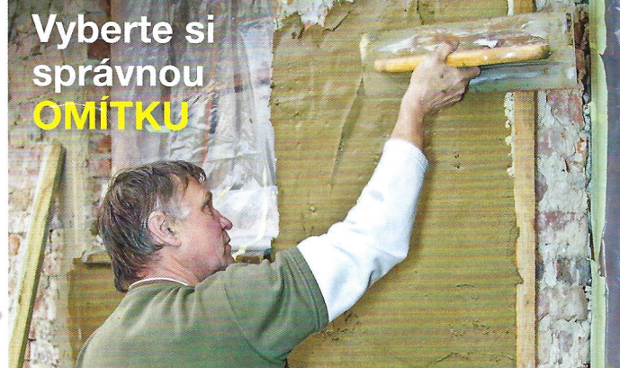
Vyberte si správnou OMÍTKU