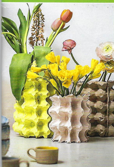
VÁZA z plata od vajec