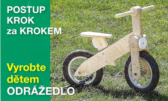
POSTUP KROK za KROKEM