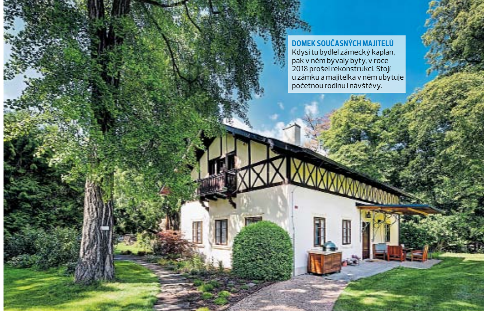
HOMEK SOUČASNÝCH MAJITELŮ Kdysi tu bydlel zámecký kaplan, pak v něm bývaly byty, v roce 2018 prošel rekonstrukcí. Stojí u zámku a majitelka v něm ubytuje početnou rodinu i návštěvy.

Interiéry zámku se podařilo vrátit do stavu z první poloviny 20. století, ale bylo zapotřebí práce několika lidí, kteří procházeli archivy, sháněli fotografie. „Patřím ke generaci vychovávané v názoru, že šlechta byla špatnou společenskou skupinou. Já tady v reálu naopak vidím, že s jejich majetky byla spojená práce a odpovědnost za to, aby je udrželi a rozvíjeli. Majitel panství musel být schopným manažerem a finančně za-