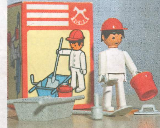
ZEDNÍK VŮBEC PRVNÍ IGRÁČKOVOU PROFESÍ BYL V ROCE 1976 ZEDNÍK I S NEZBYTNÝMI DOPLŇKY.

Ale stálo to za to! O igračkoví s rouškou mluví majitel jako o jednom dosud z nejlepších nápadů v historii firmy, který