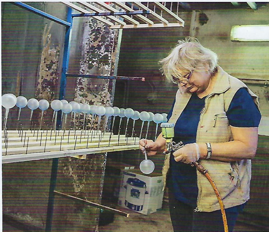
↑ ZAČÍNÁJÍ SE VYBARVOVAT. Průhledné ozdoby putují do stříkárně, kde získají barevný základ. Stříkácí pistole je připojená na kompresor a celý prostor je intenzivně odvětráván. I zde je všechno ruční práce.