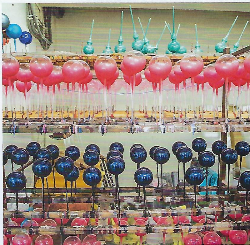
↑ DLOUHÁ TRADICE. Malované foukané ozdoby se začaly vyrábět od poloviny 19. století v durynském městě Lauscha. V Čechách začaly první vznikat od 60. let.

↓ KRAJ SKLÁŘŮ. Výroba malovaných skleněných vánočních ozdob má na Chrudimsku tradici. Vznikaly v bývalých provozovnách firmy Růckl v Horním Bradle a v Trhové Kamenici. Družstvo Vánoční ozdoby Dvůr Králové, kterému patřily, je ale postupně uzavřelo. Koulier se zatím orientuje na český trh, bude mít dvě vlastní prodejny a e-shop a dodává přímo velkým firmám. V budoucnu plánuje i vyvážet, hlavně do Německa, Rakouska, Švýcarska a do Velké Británie.