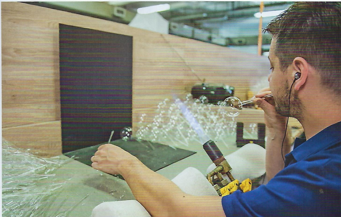
↑ STOVKY DENNĚ. Koulier letos na Vánoce připraví 60 tisíc ozdob, ale ambice do dalších let jsou mnohem větší. Dodávky se mají přiblížit milionu kusů.