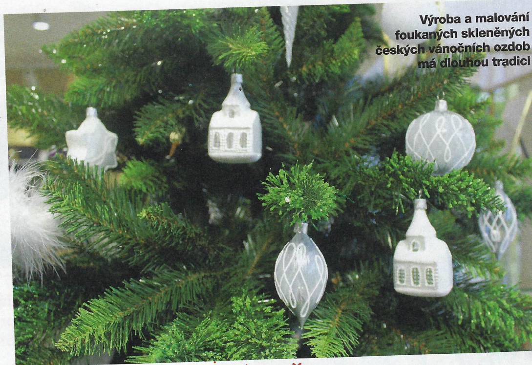
Výroba a malování foukaných skleněných českých vánočních ozdob má dlouhou tradici

Nakonec se koule malují, pěkně ručně. Barvami nebo lepidlem, na které se poté nasypou třpytky či jemné korálky. Dílo se završí tím, že se k němu připevní očko na zavěšení, labutím se ještě přidá perí a ozdoby mohou do krabic.