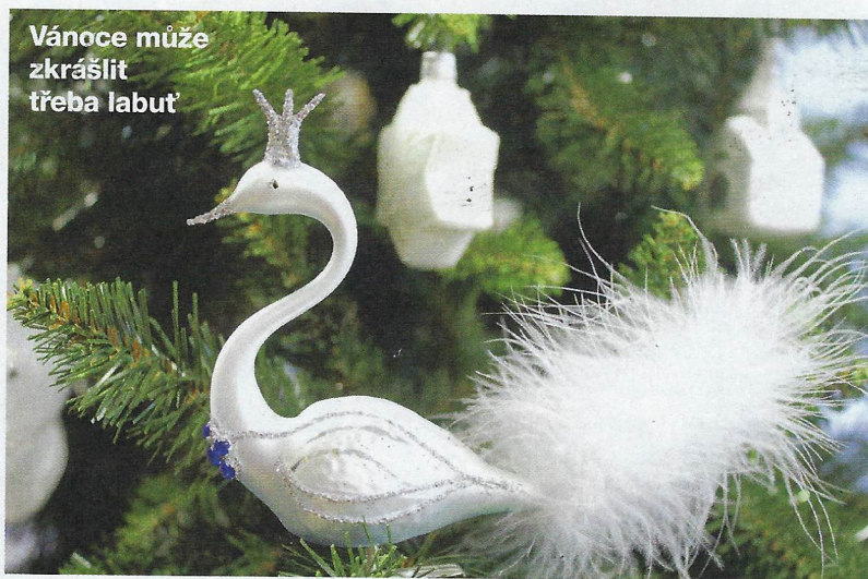
Vánoce může zkrášlit třeba labuť

Do ozdob se vpraví speciální směs, která se až po důkladném třepání rozprostře po celém vnitřku. Pak se baňky vypláchnou a nechají usušit.