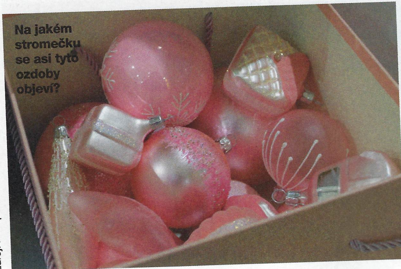
Na jakém stromečku se asi tyto ozdoby objeví?

... nejdražší vánoční ozdoba ve tvaru koule byla oceněna v přepočtu na téměř 2,5 milionu korun? Zlatník Mark Hussey z anglické obce Titchfield ozdoby vyrobil z 18karátového zlata, posázel 1500 diamanty, rubíny a pracoval na ní takřka rok. Svě dílo představil v roce 2009.