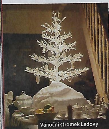
Vánoční stromek Ledový